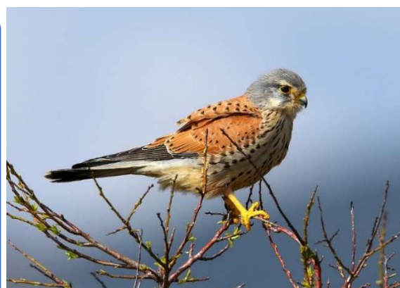
Faucon crécerelle

Le régime alimentaire de ce petit faucon est constitué surtout de micromammifères, principalement des petits campagnols, et participe donc à leur non-prolifération.