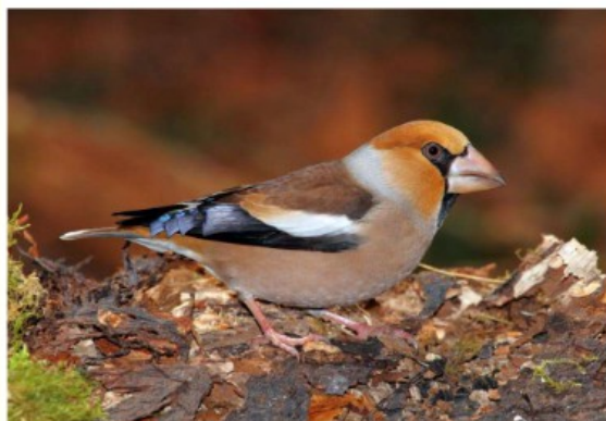
Grosbec casse-noyaux

Du haut de ses 18 cm, le Grosbec casse-noyaux est le champion en titre de sa catégorie : les oiseaux granivores (qui mangent des graines). Pourvu d'un bec démesuré, ce passereau est capable d'exercer une pression de 30 à 47 kg par cm 2 ce qui lui permet de briser des noyaux de cerise et même d'olive d'une seule pression de bec. Cet incroyable outil actionné par une puissante musculature lui permet d'éviter une concurrence pour l'alimentation avec d'autres granivores mangeant des graines plus petites. Bien qu'il ait cet impressionnant bec et la tête rousse, le Grosbec casse-noyaux est difficile à observer. Fréquemment caché dans la cime des arbres, c'est un oiseau discret que l'on repère bien souvent uniquement lorsqu'il émet son cri : des « tiek » brefs suivis par de « tsii-iiih » trainants et aigus. Pourtant si nous sommes bien attentifs, nous pourrions voir certains individus de l'Europe de l'ouest et central venir passer l'hiver dans nos jardins.